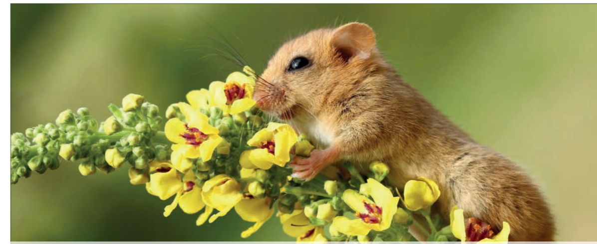
HASSELMUS (MUSCARDINUS AVELLANARIUS)

Cowslips have previously been used in medicine. Tea made from the flowers is known to calm nervousness and insomnia, as well as soothing for headaches and colds.