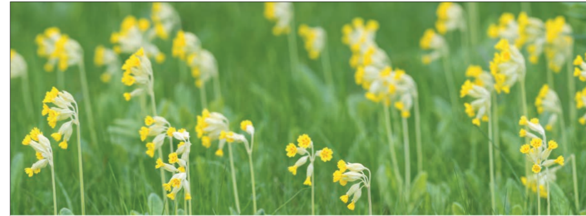
GULLVIVA PRIMULA VERIS