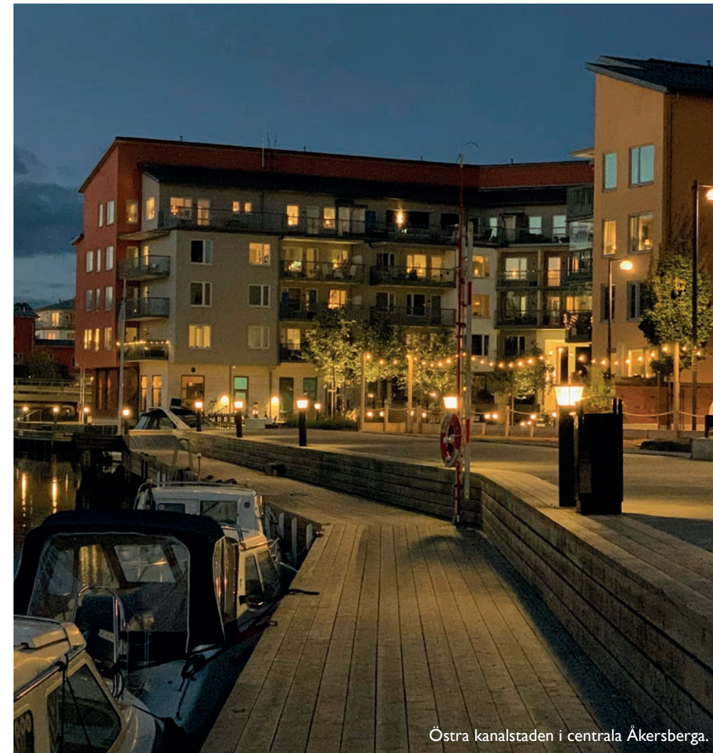
Östra kanalstaden i centrala Åkersberga.