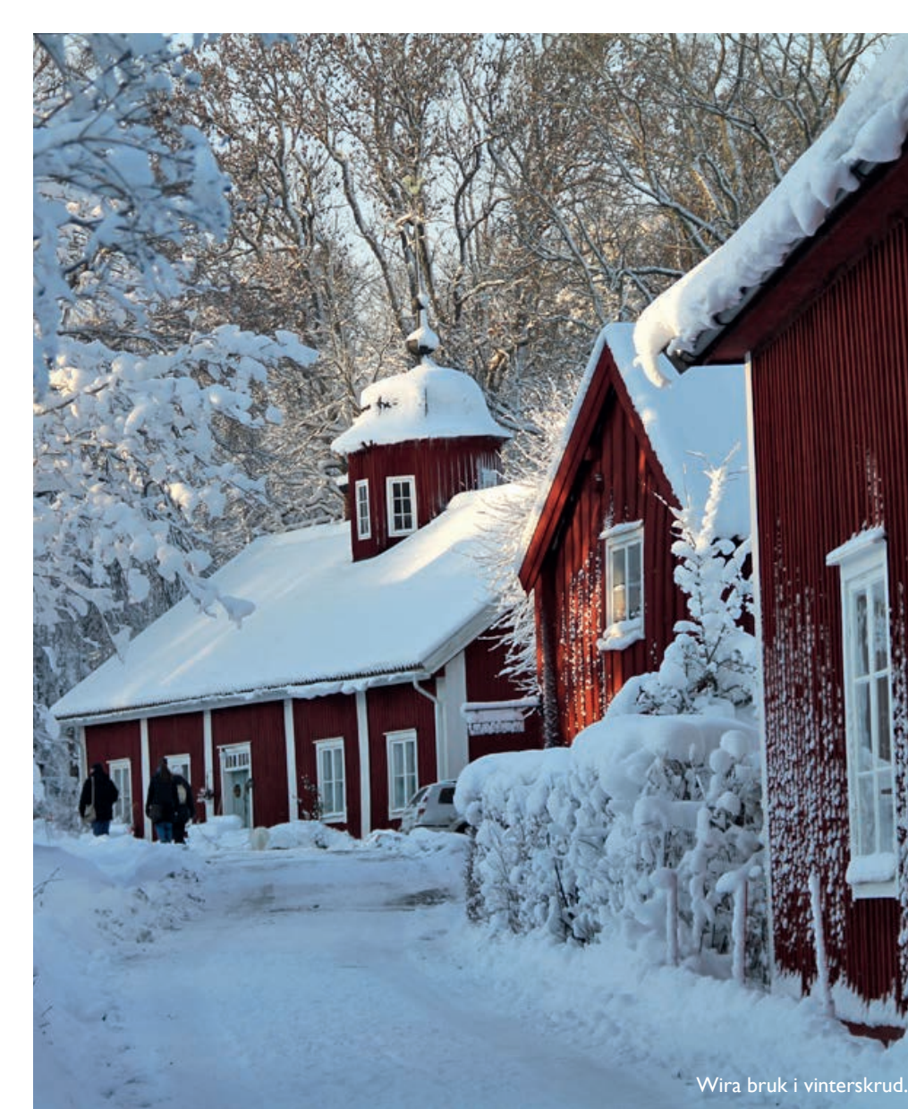
Wirra bruk i vinterskud.