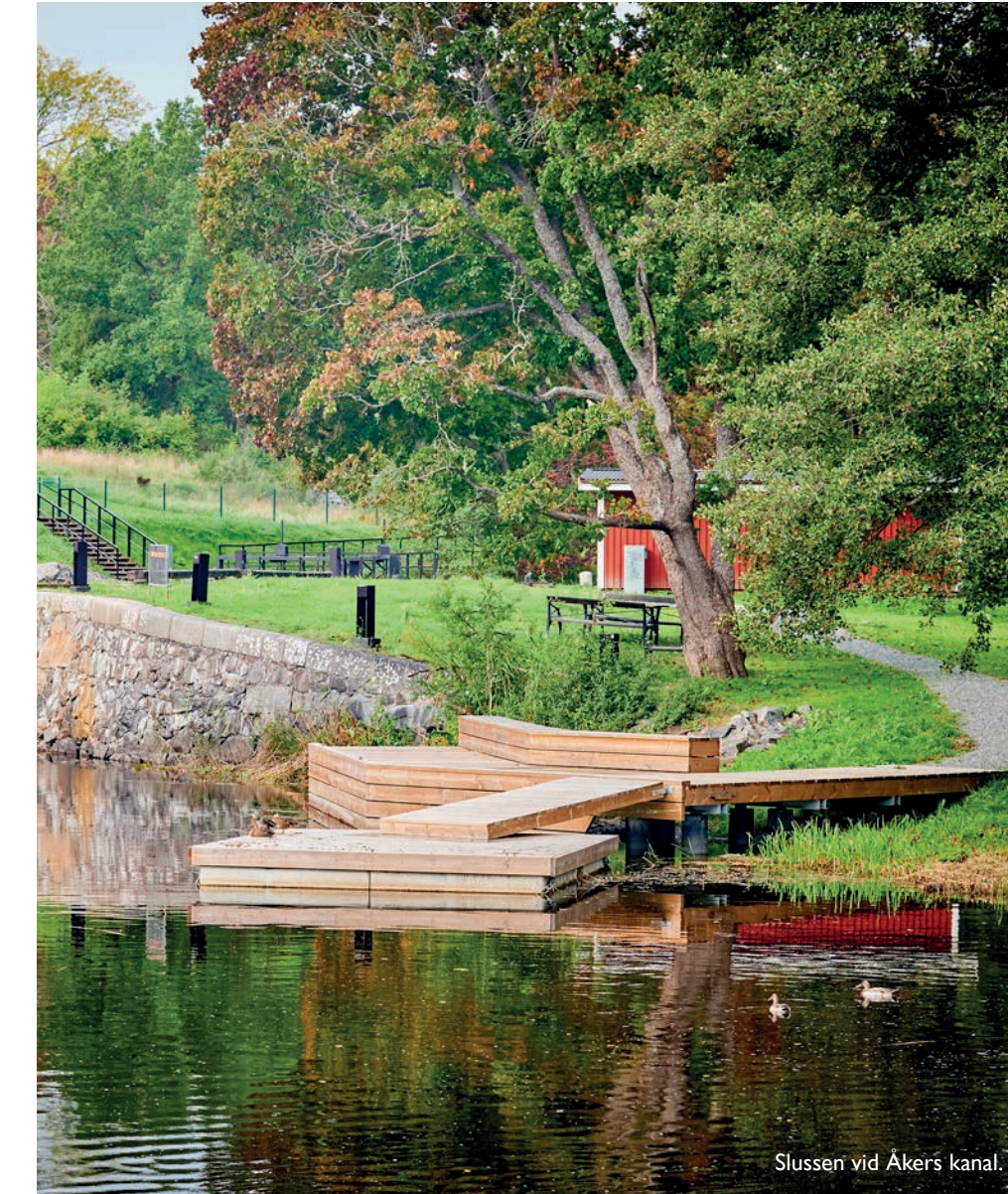
Slussen vid Akers kanal.