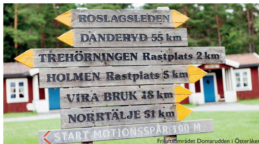
Friluftsområdet Domarudden i Österåker.