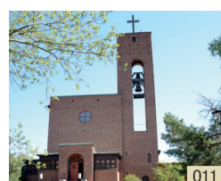
Västerledskyrkan Västerleds kyrkväg 1-7 i Äppelvikens.

Välkommen att ta del av ett brett och varierat musikutbud i kyrkan i sommar!