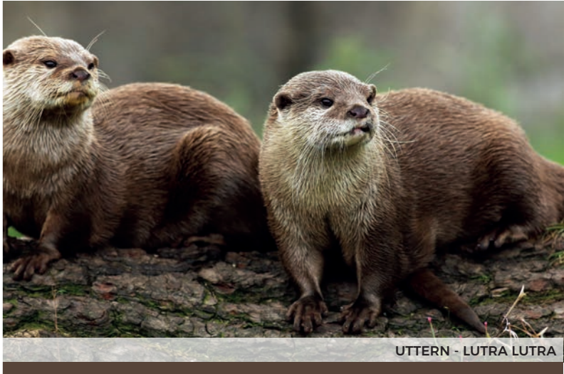
UTTERN - LUTRA LUTRA

Kronobergs län som inrättades 1674 utgör den sydvästra delen av landskapet Småland. I söder gränsar Kronoberg till Blekinge och Skåne län, i väster till Hallands län, i öster till Kalmar län och i norr till Jönköpings län. Länet bjuder på vacker natur med mycket skogar och sjöar där besökaren får härliga naturupplevelser. Här finns bland annat Glasriket, världens första IKEA, ett handpappersbruk, Växjö domkyrka och Linnés födelseplats, Linnés Råshult.