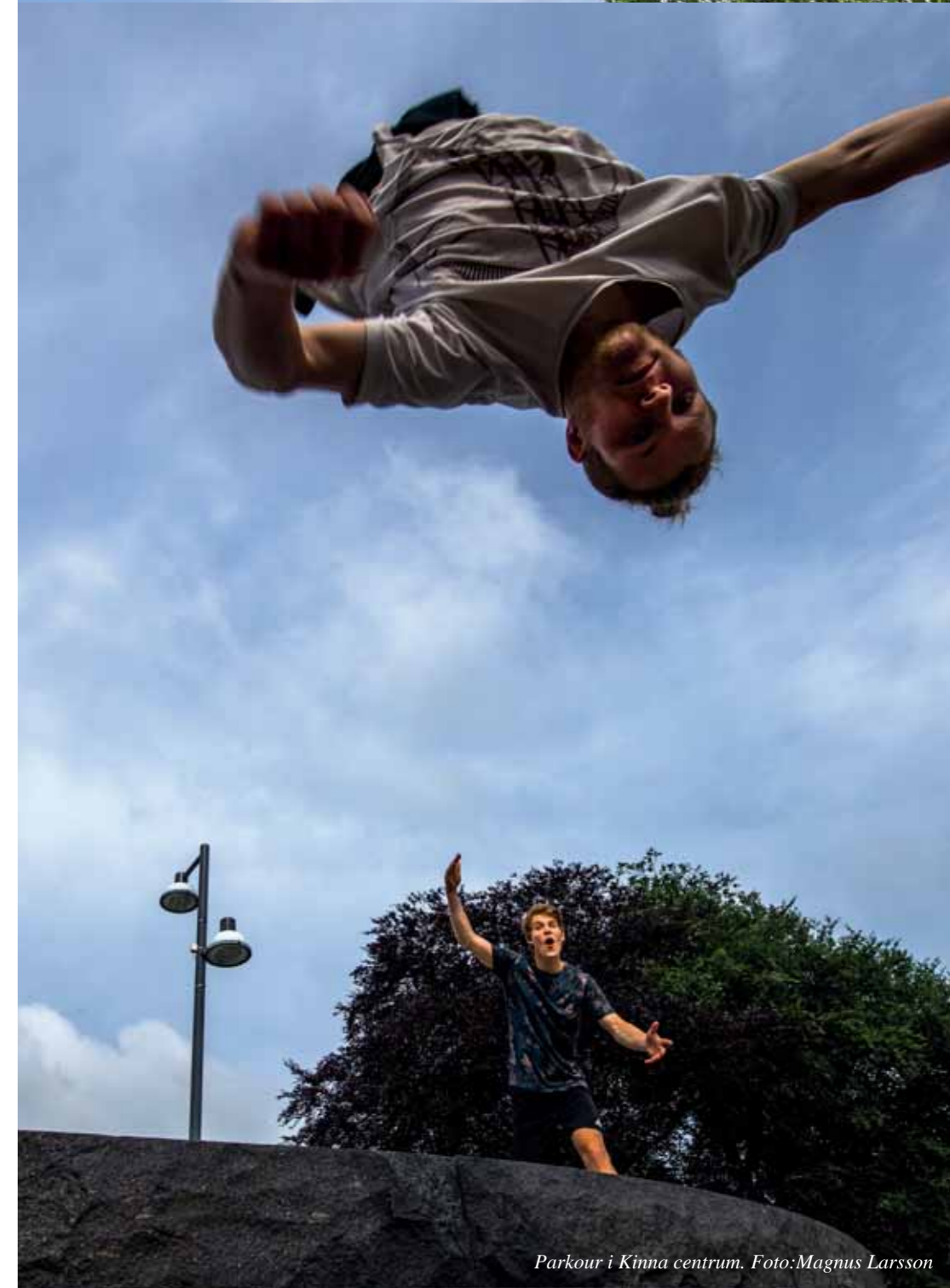
Parkour i Kinna centrum.