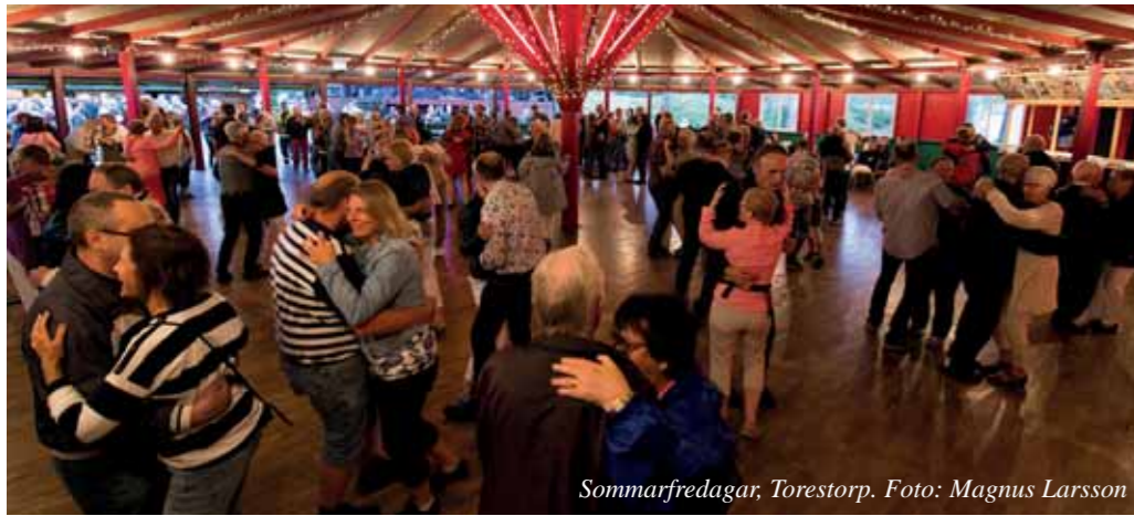
Sommarfredagar, Torestorp.

Mark was founded in 1971 with Kinna as the main town. The municipality has about 34 000 inhabitants. The spirit is one of openness and affinity. Here is a possibility to realize dreams in an environment close to nature, neighbour, school and welfare. Also it is close to big city life as well as the ocean.