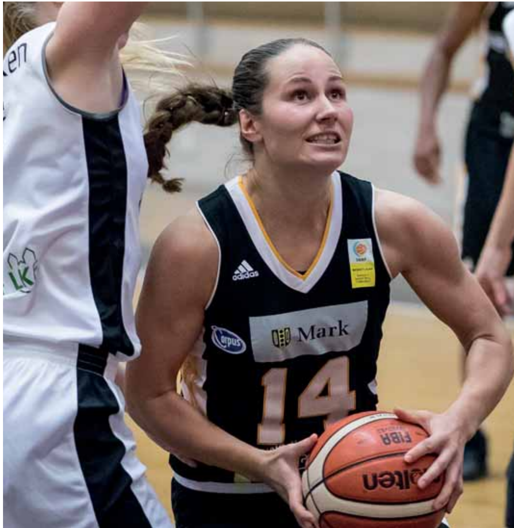
Mark Basket.

I Mark möts du av storslagen natur i ett varierande landskap. Vandringsleder och natursköna småvägar erbjuder omväxlande vandring och cykling. Du finner goda möjligheter till fiske och bad. Vill du ta en paus finns det mysiga kaféer och andra trevliga ställen att njuta av. Stanna gärna en natt på något av våra vandrarhem, Bed and Breakfast eller hotell.