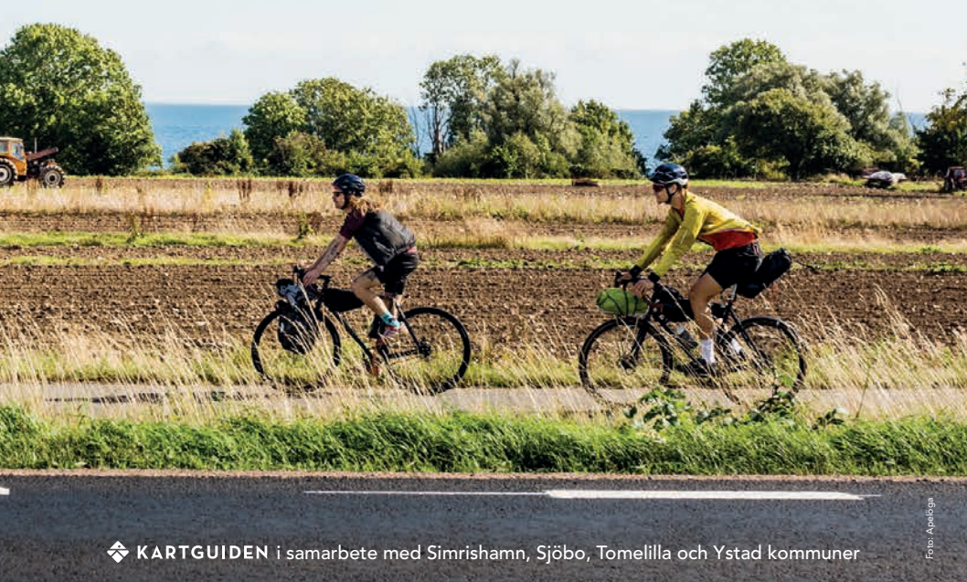
KARTGUIDEN i samarbete med Simrishamn, Sjöbo, Tomelilla och Ystad kommuner